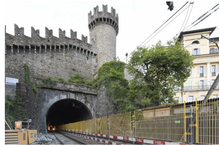
Bahntunnel Svitto mit Burg

Bauwerke aus Natursteinmauerwerk sind ein wichtiger Bestandteil des Schweizer Eisenbahnnetzes. Dazu zählen nicht nur Brücken, sondern auch Tunnel und Stützmauern. Die meisten dieser Bauwerke wurden um die 19./20. Jahrhundertwende gebaut und haben daher die Lebensdauer von 100 Jahren bereits erreicht. Da diese Bauwerke aber zahlreich und wichtig sind und oft unter Denkmalschutz stehen, werden sie selten rückgebaut, sondern instandgesetzt und verstärkt um ihre Funktion weiterhin erfüllen zu können.