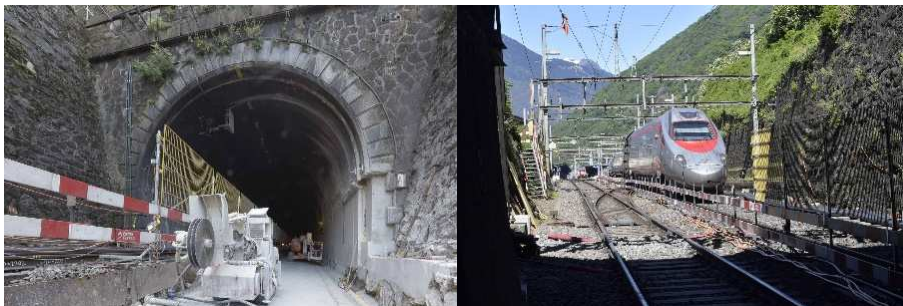
Portal Svitto-Tunnel